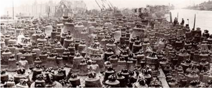
Glockenfriedhof in Hamburg während des zweiten Weltkrieges